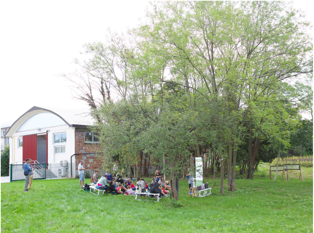
Area esterna e centro culturale Le(Serre)